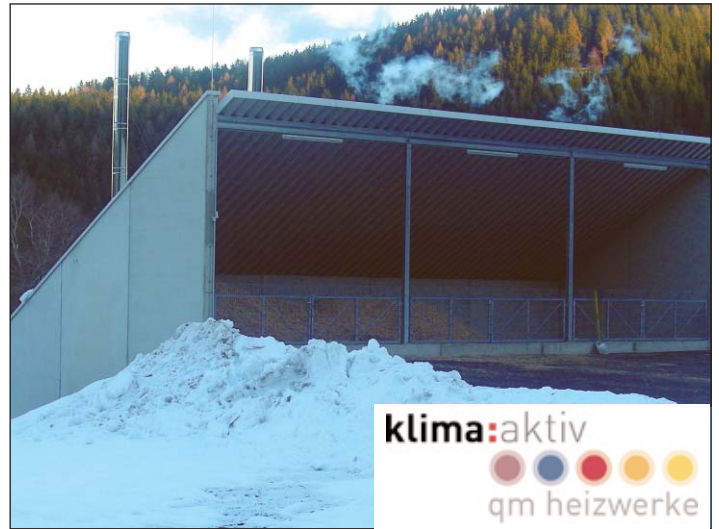
Die neue Heizzentrale der Firma Waldkraft GmbH am Areal des Sägewerks Wrodnigg in Kraig.

Kraig bleibt das Wohnen mit niedrigen Betriebskosten attraktiv.